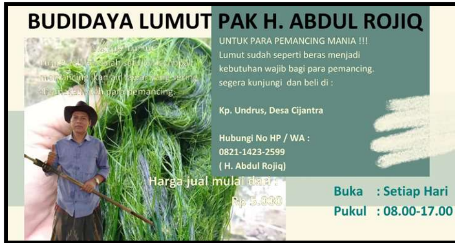
Gambar 1.2 Pamflet Promosi Budidaya Lumut