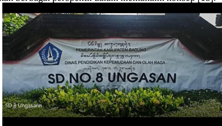
Gambar 1. SD Negeri 8 Ungasan

Siswa belajar berpikir logis dan mempertimbangkan berbagai sudut pandang dalam memahami konsep pembelajaran di antara usia sebelas dan dua belas tahun. Pada usia sebelas hingga dua belas tahun, peralihan dari tahap operasional konkret ke tahap operasional formal terjadi. Pada tahap ini, siswa mulai belajar berpikir logis dan mempertimbangkan berbagai perspektif dalam memahami konsep [15].