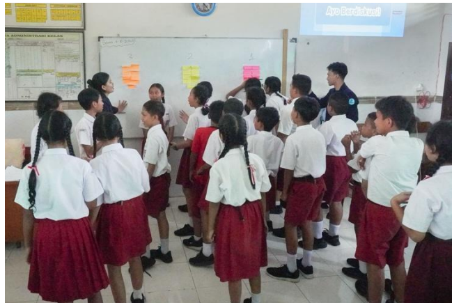
Gambar 5. Sesi Games Interaktif

Kegiatan ini memiliki permainan reflektif yang membantu siswa memahami nilai kesetaraan selain diskusi. Siswa dapat belajar bekerja sama tanpa membedakan peran berdasarkan jenis kelamin melalui aktivitas ini.