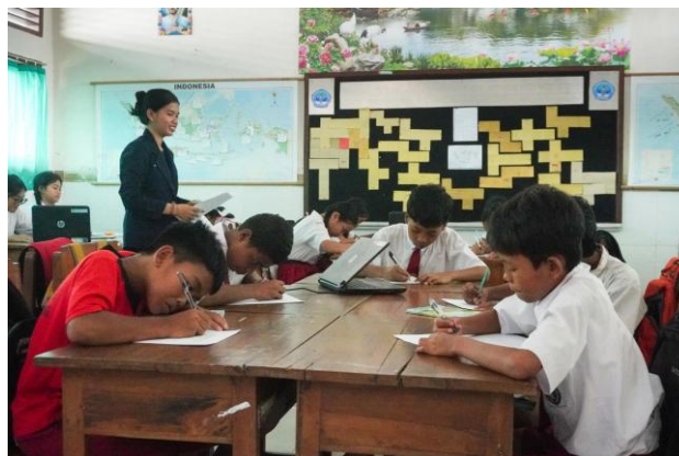
Gambar 3. Pelaksanaan pre-test