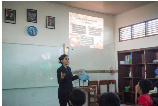
Gambar 6. Penyampaian Materi Storytelling Interaktif

Pernyataan tersebut menunjukkan bahwa pembelajaran tidak hanya memberi siswa informasi baru tetapi juga mengubah cara mereka melihat peran gender dalam kehidupan sehari-hari.