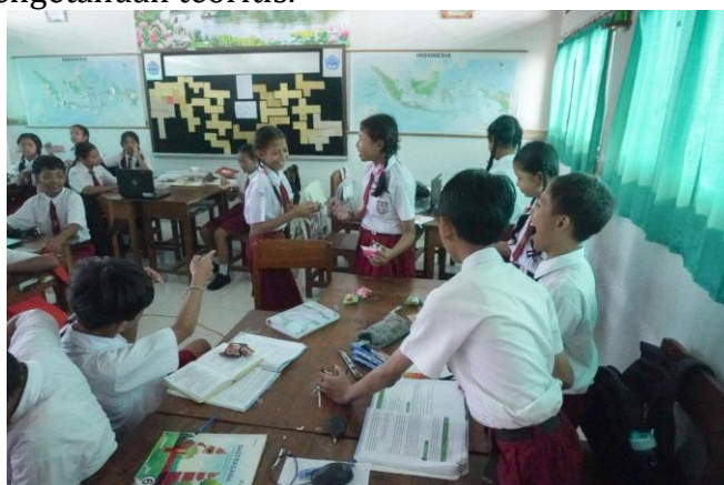
Gambar 4. Diskusi

Pendekatan cerita dipilih karena lebih mudah dipahami oleh siswa sekolah dasar dan mampu menghadirkan situasi yang nyata. Dengan demikian, siswa diajak untuk merenungkan pengalaman sosial yang mungkin mereka temui dalam kehidupan sehari-hari selain memperoleh pengetahuan teoritis.