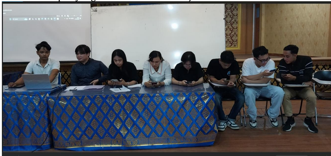
Gambar 2. Presentasi Mahasiswa Reguler Tentang Ekonomi Kreatif sektor Kuliner

Dinamika kegiatan turut mendorong terbentuknya kelompok-kelompok mahasiswa yang memiliki minat serupa dalam pengembangan usaha kreatif. Kelompok ini berpotensi berkembang menjadi komunitas kewirausahaan mahasiswa yang berkelanjutan di lingkungan perguruan tinggi. Secara umum, program pengabdian ini berhasil meningkatkan pengetahuan, keterampilan, motivasi, serta kepercayaan diri mahasiswa dalam bidang kewirausahaan berbasis ekonomi kreatif, sekaligus mendorong terbentuknya ekosistem kewirausahaan kampus yang inovatif dan berkelanjutan.