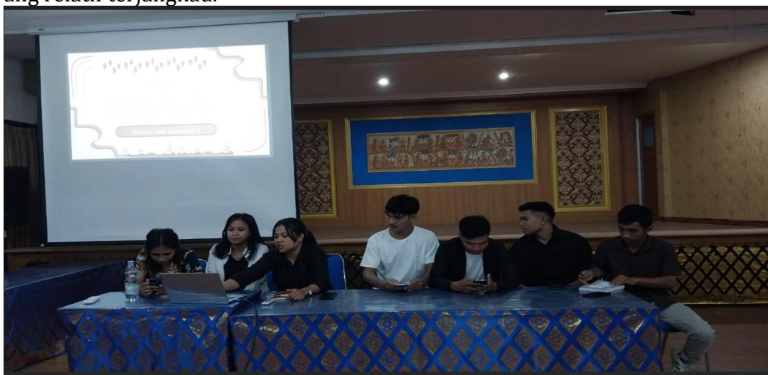
Gambar 1. Presentasi Mahasiswa Reguler Tentang Ekonomi Kreatif sektor Kerajinan Tangan

Hasil kegiatan menunjukkan adanya perubahan pola pikir mahasiswa terhadap kewirausahaan. Sebelum pelatihan, sebagian besar peserta masih berorientasi sebagai job seeker , namun setelah mengikuti kegiatan mereka mulai lebih terbuka terhadap peluang usaha mandiri dan termotivasi menjadi job creator . Perubahan tersebut terlihat dari meningkatnya antusiasme, keberanian berdiskusi, serta partisipasi aktif dalam setiap tahapan kegiatan. Selain itu, mahasiswa juga mulai menyadari bahwa kreativitas dan inovasi dapat menjadi modal penting dalam membangun usaha berbasis ekonomi kreatif dengan biaya yang relatif terjangkau.