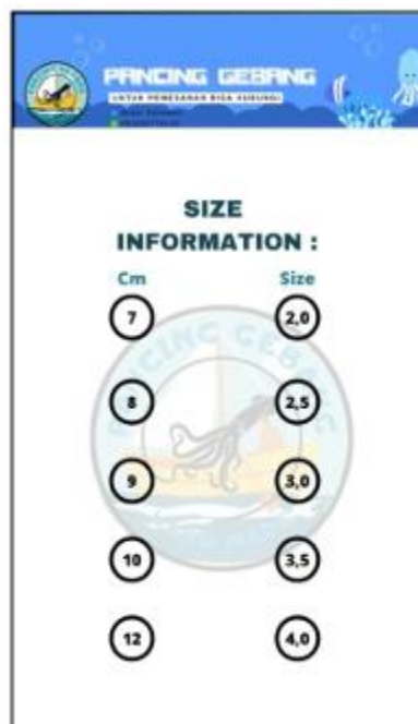
Gambar 4. Tampilan Penuh dari Desain Kemasan

3. Gambar 4 berikut ini merupakan tampilan penuh desain kemasan yang sudah digabungkan dan siap untuk dicetak: