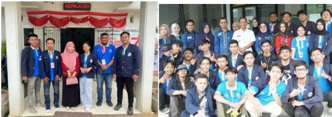
Gambar 1. Pengantaran Mahasiswa PKPM di Kecamatan Teluk Pandan Kabupaten Pesawaran Lampung Selatan

Gambar 1 berikut merupakan pengantaran mahasiswa PKPM di Kecamatan Teluk Pandan Kabupaten Pesawaran Lampung Selatan: