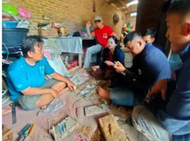
Gambar 5. Kegiatan Membantu Pengolahan Umpan Cumi di UMKM Pancing Gebang

Desain kemasan UMKM Pancing Gebang pada produk Umpan Cumi dapat memberikan pengaruh kepada penjual dikarenakan bisa membantu penjual dalam melakukan pemasaran produk. Salah satunya adalah memasarkan produk menggunakan strategi pemasaran dengan memaksimalkan Aplikasi Desain yang efektif dan efisien.