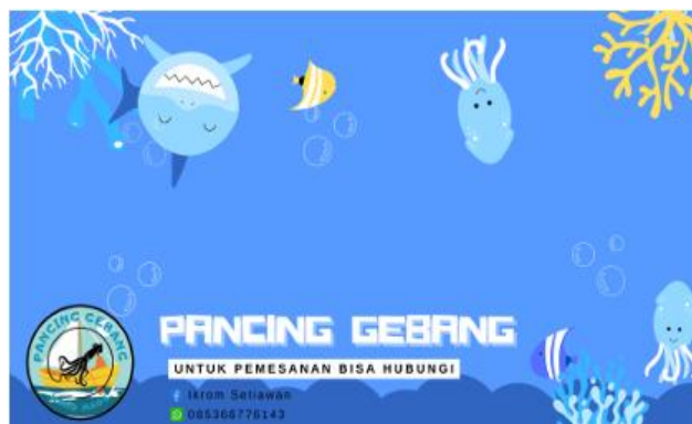
Gambar 2. Desain Kemasan Produk pada UMKM Pancing Gebang

1. Gambar 2. di bawah ini merupakan desain terbaru dari kemasan produk pada UMKM Pancing Gebang: